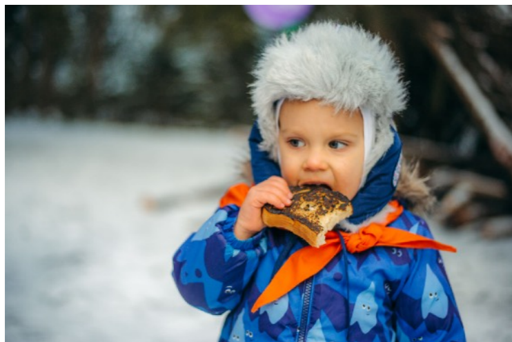
КАБЮНИТ 4-8 лет

Кабюнитом может стать любой ребенок. В принятии решений ему помогает родитель и до 7 лет сопровождает в лагере. Цель лагеря в этом возрасте привить любовь к природе и окружающим. В лагере участвуют в: