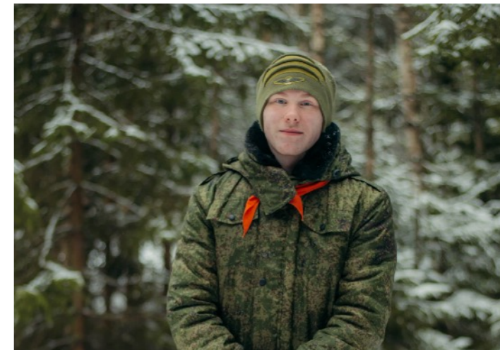
СТАРШИЙ ЮНИТ 14-17 лет

Старшим юнитом может стать подросток, достигший возраста 14 лет и имеющий разряд минимум юнита 1-го уровня. В лагере является помощником вожатого. Цель лагеря – развитие лидерских качеств. В лагере участвует в тех же программах, что и юниты.