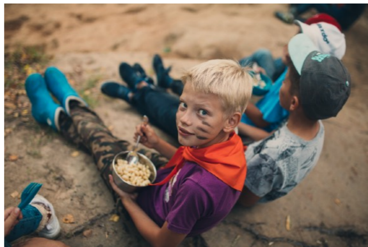
ЮНИТ 9-13 лет

Юнитам может стать любой ребенок. Он уже самостоятельно принимает решение. В лагере находится без родителя. Цель лагеря развить самостоятельность, ответственность, творчество, стремление, командное взаимодействие. В лагере участвует в: